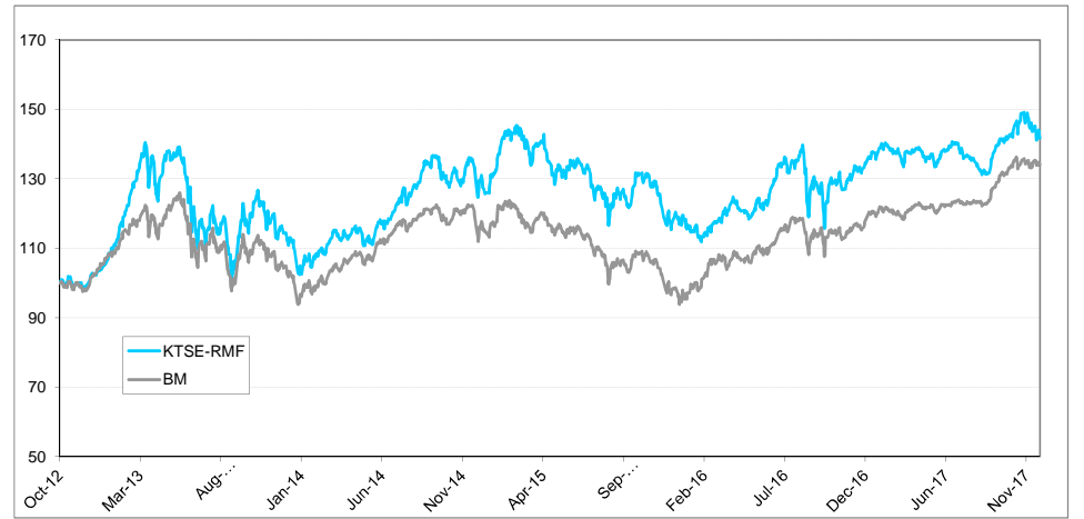
หมายเหตุ: กราฟเริ่มต้นที่ 100 ทั้งกองทุนและดัชนีเปรียบเทียบ