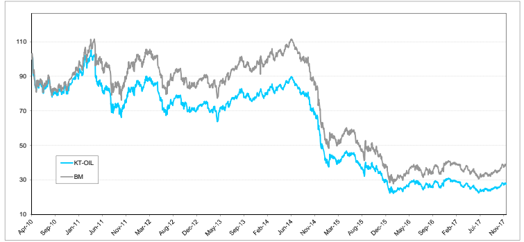
หมายเหตุ:กราฟเริ่มต้นที่ 100 ทั้งกองทุนและดัชนีเปรียบเทียบ