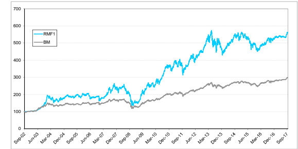
หมายเหตุ:กราฟเปรียบเทียบ 100 เท่าของทุนและดัชนีเปรียบเทียบ