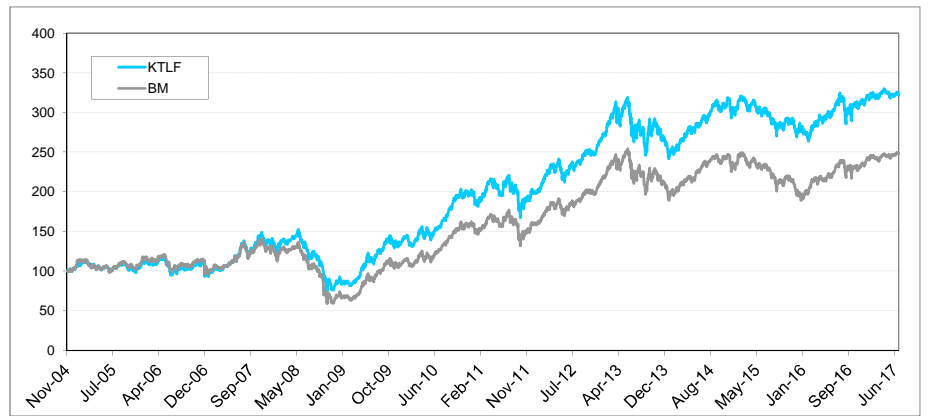
หมายเหตุ 1. กราฟเริ่มต้นที่ 100 ทั้งกองทุนและดัชนีเปรียบเทียบ 2. กราฟผลตอบแทนรวมเงินปันผลและเงินปันผลลงทุนต่อในกองทุน (Dividend Reinvest)