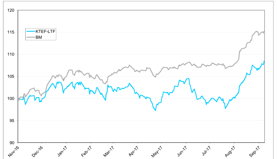
หมายเหตุ: กราฟเริ่มต้นที่ 100 ทั้งกองทุนและดัชนีเปรียบเทียบ