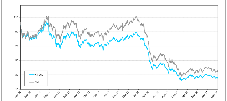
หมายเหตุ:กราฟเริ่มต้นที่ 100 ทั้งกองทุนและดัชนีเปรียบเทียบ