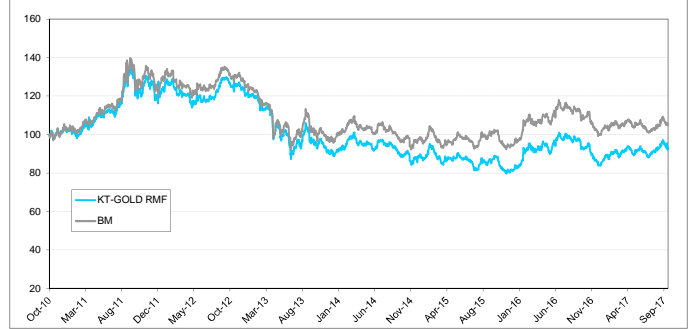
หมายเหตุ: กราฟเริ่มต้นที่ 100 ทั้งกองทุนและดัชนีเปรียบเทียบ