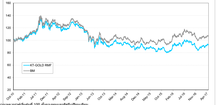
หมายเหตุ: กราฟเริ่มต้นที่ 100 ทั้งกองทุนและดัชนีเปรียบเทียบ