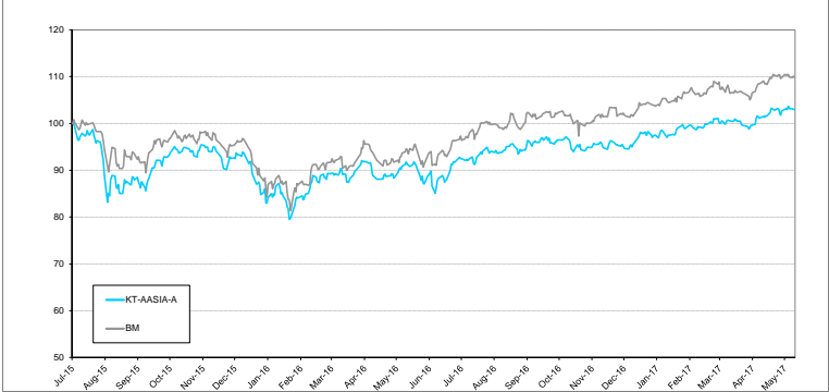
หมายเหตุ: กราฟเริ่มต้นที่ 100 ทั้งกองทุนและดัชนีเปรียบเทียบ