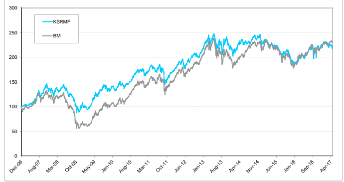
หมายเหตุ: กราฟเริ่มต้นที่ 100 ทั้งกองทุนและดัชนีเปรียบเทียบ